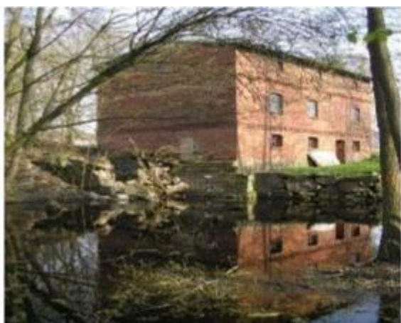
Młyn nad Orlą w Sadkowskim Młynie

W Gminie Sadki Orła to najczystsza z rzek. Stanowi jeden z głównych walorów przyrodniczych. W Radziczu, przez który przepływa, w miejsce dawnego młyna wodnego (spłonął przed laty) zbudowano małą elektrownię wodną. Dwa zabytkowe młyny wodne zachowały się z kolei w Broniewie. Kolejny usytuowany malowniczo jest również w Sadkowskim Młynie. Natomiast w Kraczkach rozlewisko Orli w zabytkowym parku jest naprawdę pięknym i tajemniczym miejscem. Usytuowane tuż za mostem, pośród pomnikowych okazów drzew, gdzie występują stanowiska łąkowe żurawi, których wiosenny krzyk niesie się szczególnie daleko.