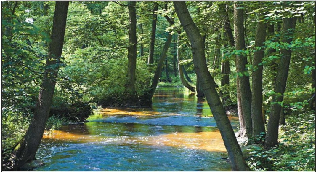
Rzeka Orla w Radziczu