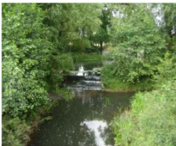
Rzeka Orła w Radziczu