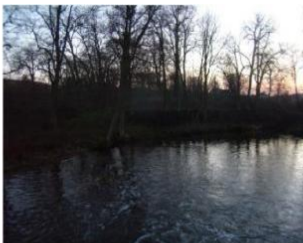
Zabytkowy park nad rozlewiskiem Orli w Kraczkach