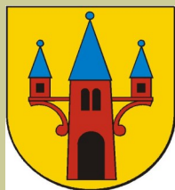
Nakło n. Notecią